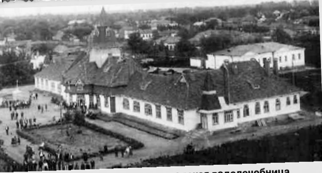
Так выглядела первая миргородская водолечебница

память нашего земляка Николая Гоголя. Но главное — стараемся, чтобы в Миргороде (вслушайтесь в его название!) чувствовалась атмосфера мира и добра, уважительное и бережное отношение ко всему, что нас окружает, а особенно — к людям. Они приезжают сюда не только с желанием стать здоровее, излечиться от болезней, но и для того, чтобы сменить стремительный жизненный ритм на состояние гармонии и умиротворения. Чтобы создать такую атмосферу, на 43 гектарах нашего парка было высажено 10 тысяч деревьев и кустов, ежегодно на клумбах появляется 60 тысяч цветов. Дизайнеры придумывают, как сделать настолько привлекательными десятки уголков парка, чтобы нашим гостям захотелось там сфотографироваться и затем показать фото друзьям, а тем — приехать