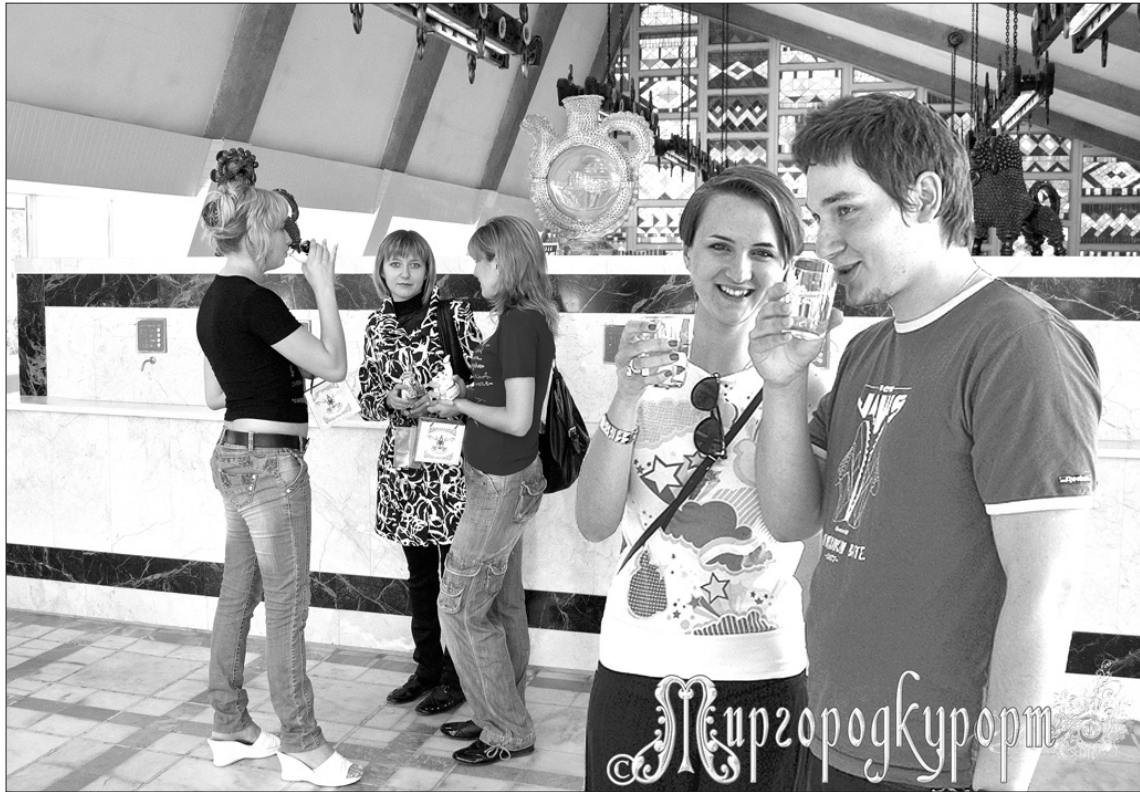
В бюветі курорту

рослих. Для зручного сімейного відпочинку, поки дорослі приймають процедури, дітям пропонують сучасно оснащену ігрову кімнату, де з малечю працює висококваліфікований вихователь з вищою освітою.