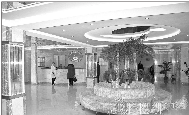
Хол курортної поліклініки

про їх сучасне матеріально-технічне оснащення та справжні дива, які тут створюються. Санаторій «Хорол», крім основного профілю — лікування органів травлення, спеціалізується на оздоровленні вагітних жінок та реабілітації хворих після радикальної терапії з приводу онкологічної патології. В санаторії функціонує відділення, де лікують захворювання жіночих статевих органів, зокрема безпліддя, що є сьогодні актуальною проблемою. Санаторій «Хорол» займається також оздоровленням дітей із захворюваннями органів травлення в супроводі до-